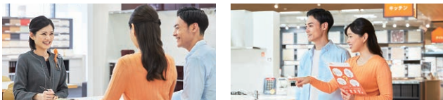
コーディネーターと一緒に見学